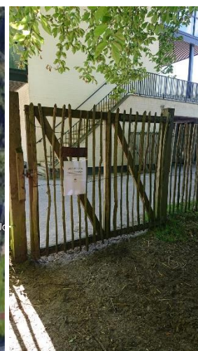
Foto: Fiets1, plek voor fietsen buiten het hek.