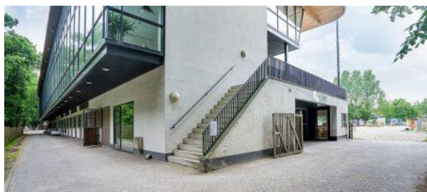
Foto: Entree Grandstand